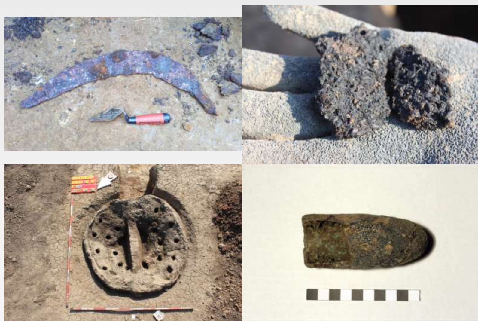
Mezőgazdasági és ipari tevékenység nyomai

A vaskori település nyugati felén térképre vittük az épületek és a gödrök pozícióját, így lehetőségünk nyílt a település struktúráját is vizsgálni. A térképen nincsenek külön szétválasztva a szkíta és a kelta objektumok, egyrészt a feldolgozottság foka miatt, valamint nagyrészt egykorú a település (korábbi szkíta periódusra utaló nyomok vannak, de elkülönítésük még nem történt meg). A kerek, illetve szögletes alaprajzú épületekből az esetek többségében a két kultúra leletanyaga keveredve került elő, valamint két-három esetben fordult elő olyan, hogy szkíta jellegű épületet vágott kelta objektum. Ezek alapján egy békés együttélés képe rajzolódik ki a településen. A korszakból három gödörbe helyezett halottat is feltártunk, azonban haláluk jellege nem utal erőszakos cselekményre.