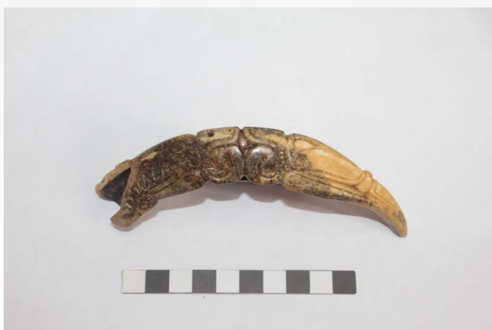
Szauromata állatstílussal díszített vadkanagyar amulett

A térképen egyes épületekhez, épülethozzártásokhoz tartozó gödör sűrűsödéseket lehet megfigyelni, amelyek utalhatnak a tágabb értelemben vett háztartásokra. A fémleleteket összegyűjtve, nem meglepő módon, a legtöbb tárgy az épületekből került ki. Ezek közül is kiemelkednek a műhelyként meghatározható épületek csoportja, amelyekből a legtöbb fémtárgy, szerszám és vassalak előkerült és egy területen koncentrálnak. Ebben a „műhelykörzetben” kerültek elő egy edényégető kemencével, valamint még több tűzhellyel rendelkező épületek, egyikből három bronzöntő tégely töredéke is napvilágot látott. Kerámiagyártáshoz további bizonyítékkal szolgál egy különálló fazekaskemence és egy grafitömböket tartalmazó gödör, ezek azonban a műhelyépületektől északabbra helyezkednek el.