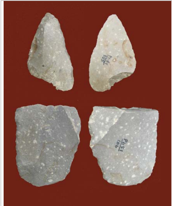
1. ábra - Swieczichów-i kovából készült kőeszközök a Sóllyomkúti barlangból

A további kutatások során Mester Zsolt fiatalabb, korai felső paleolit datálást is lehetségesnek gondol (Mester 2000) a távolság még ebben az esetben is imponáló. Ugyanennek a nyersanyagféleségnek további előfordulását regisztrálja és közli a felső paleolit korú Bodrogkeresztúr-Henye hegy esetében (Vértes 1966 p. 11).